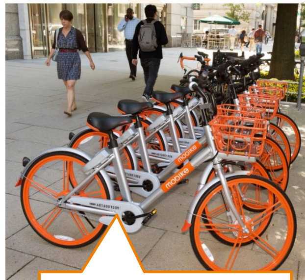
Vélo en Libre Service (VLS)