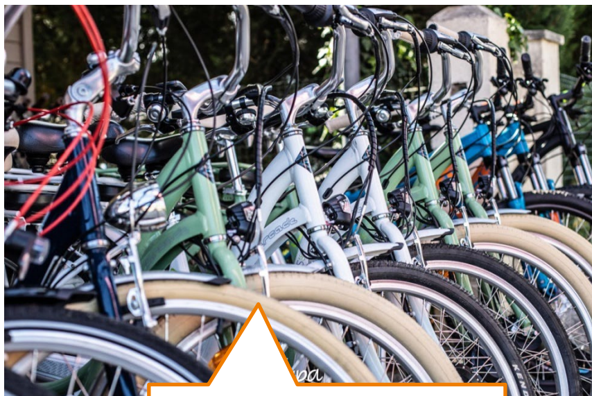
Vélo en Location Longue Durée (VLLD)